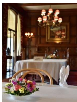
ダイニング (次の間より)